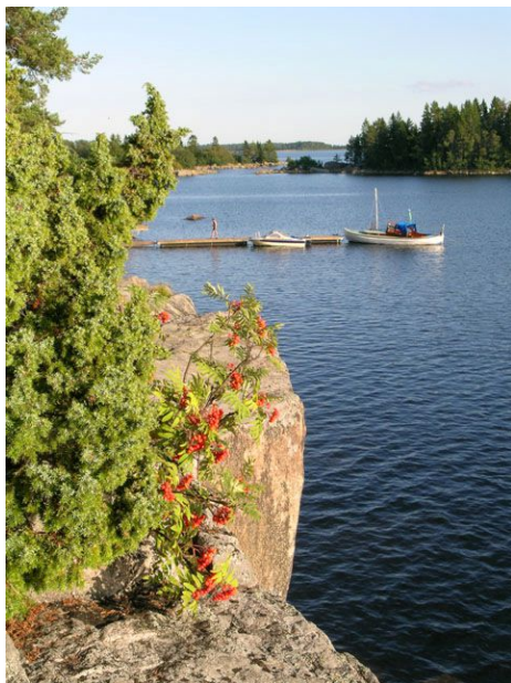
Utsikt mot söder från Branthäll.