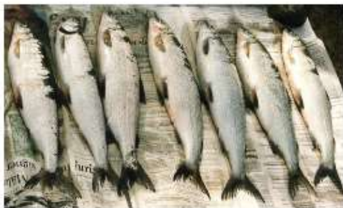
Fiskelycka på Sandskär för flera år sedan.

Hur många fiskar man får ta tillvara begränsas också: Högst tre fiskar av gös och gädda blir tillåtet att ta med sig hem.