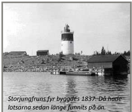
Storjungfruns fyr byggdes 1837. Då hade lotsarna sedan länge funnits på ön.