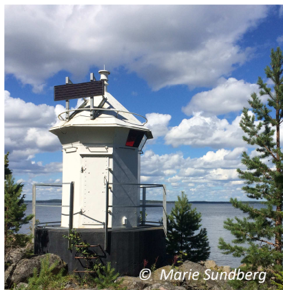
Fyren vid Klumpudden på Enskär

Turbåten M/S Moa, som man kan ta inifrån Söderhamn, angör Enskärsorn. Ön har lång sandstrand och är ett populärt utflyktsmål sommartid. Man ser ofta motorbåtar halvt uppdragna på stranden där och människor som solar och badar.